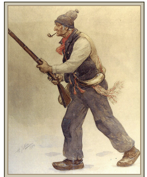
Le Vieux de 37 Gouache sur papier, peinte par Henri Julien en 1904

Le 21 janvier 2023, nous avons célébré les 75 ans de l'adoption du drapeau québécois, symbole identitaire de la nation québécoise, d'origine française, présente en sol d'Amérique depuis bientôt près de 500 ans (1534). Pour mieux comprendre sa signification, nous allons revenir sur les origines historiques et antiques de la fleur de lys, les moments importants qui jalonnent l'histoire du drapeau du Québec, sa signification et les protagonistes ou institutions qui poussent son adoption officielle par l'État du Québec, en 1948.