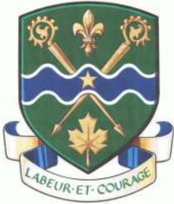
Association Lévesque Inc.

Le 28 août 2016, les membres et amis/es de l'Association Lévesque se réuniront dans la belle ville de Québec à l'Hôtel CLARION.