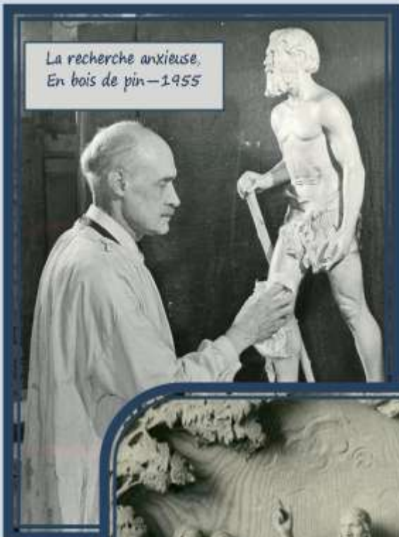
La recherche anxieuse, En bois de pin—1955