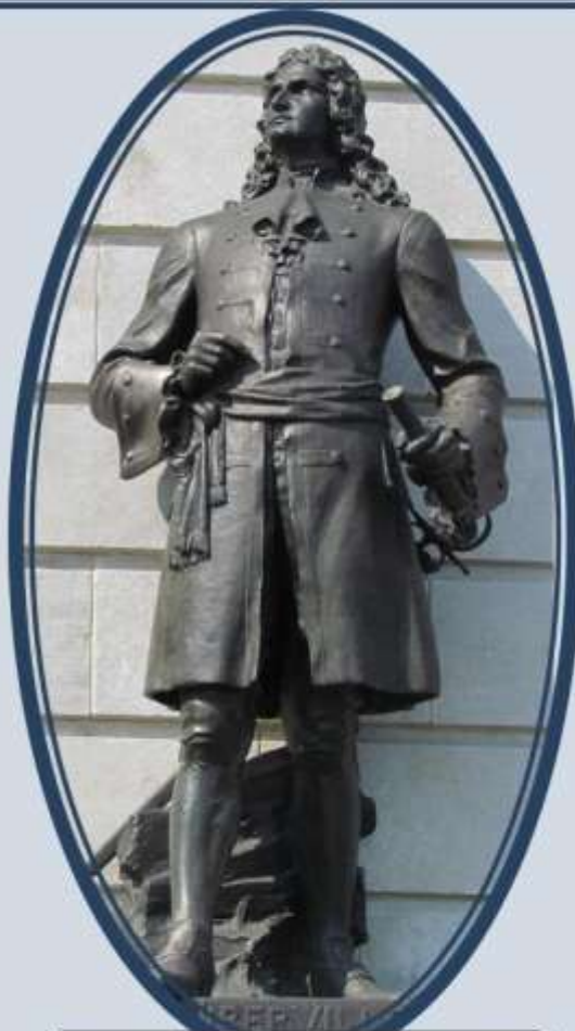
Statue de Pierre Lemoyne d'Iberville (Bronze ornant la façade du parlement de Québec)