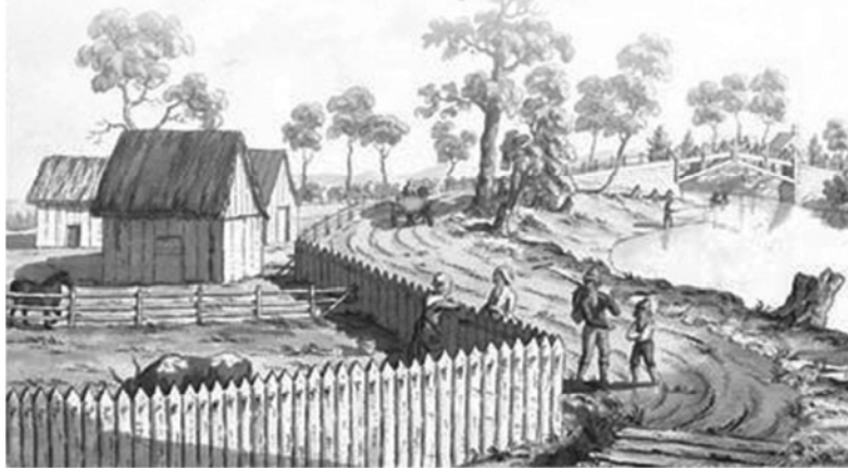
PEACHEY, James. Détail de Vue du pont sur la rivière Berthier , 1785. BAC-R3908.